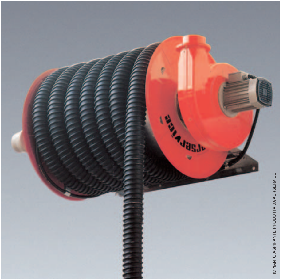
IMPIANTO ASPIRANTE - PRODOTTA DA AERSERVICE